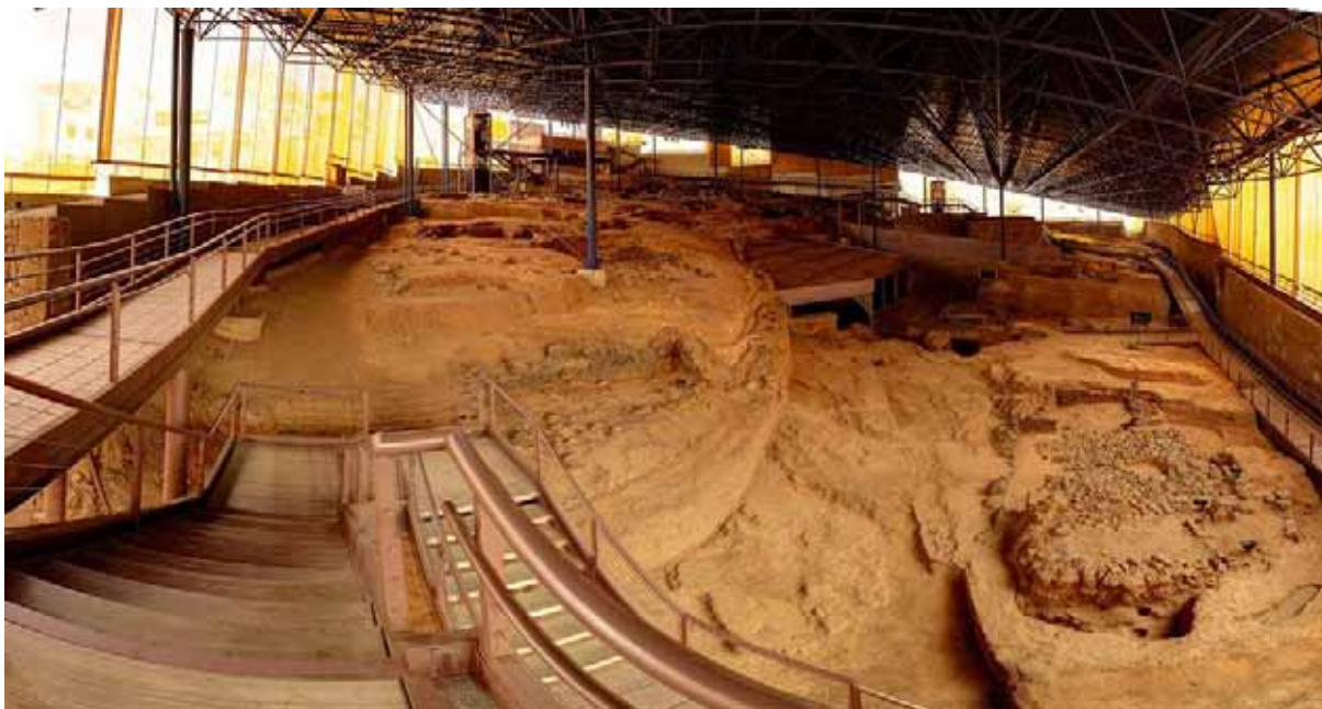
Fig. 1. Vista panorámica del yacimiento Cueva Pintada de Gáldar.