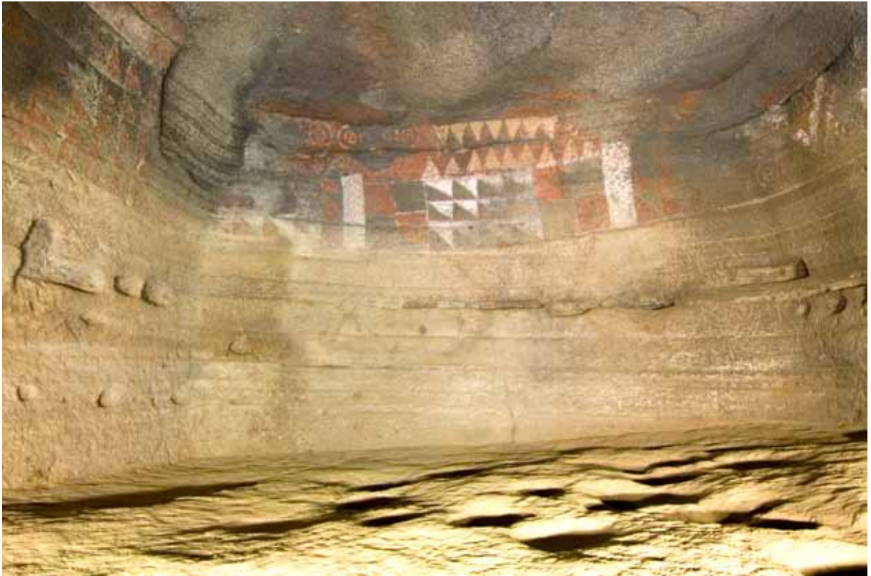
Fig. 2. Panel polícromo de la Cueva Pintada.

La colección de burgaos ( Osilinus atratus ) decorados es especialmente singular. Presentan finas incisiones, probablemente realizadas con un útil de piedra. Por el momento no se conoce exactamente la finalidad que tuvieron.